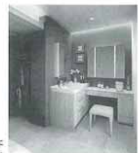
部屋の片隅に 自分専用の洗面台。

メイクやフェイスクアには 水を使います。それなら、 部屋の中に洗面台を設置すれば 心置きなくゆっくりできますね。 また、自室で趣味を楽しむ時も 手や道具が洗えたりと 水場が近いと便利です。