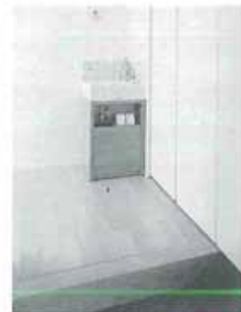
玄関のこんな一角にも洗面コーナーが。