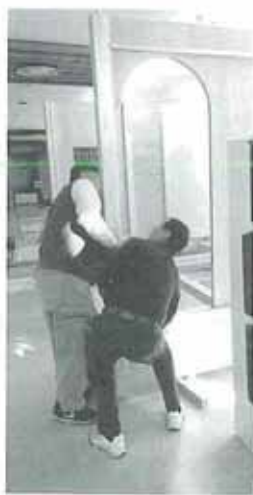
柱を敷石に落とし込み