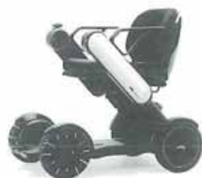
次世代型電動車椅子 『WHILL Model C』

この製品についてはホームページで詳しく見る事が出来ます。興味を持たれた方はぜひ「電動車椅子 WHILL」で検索してみてください。