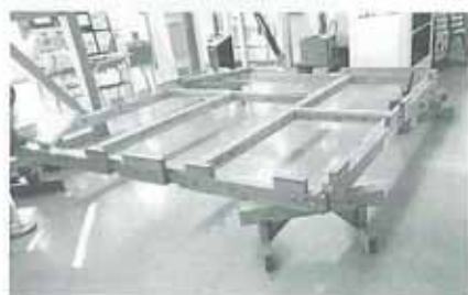
土台の仮位置決め

〈ご自宅に「癒しの空間」をしつらえませんか〉 木造住宅の一室に、また、マンションのリビングなど無機質な空間にも設置できる「組み立て式茶室」を作りました。現在ショールーム内に展示中です。今月は組み立ての様子をご紹介します。