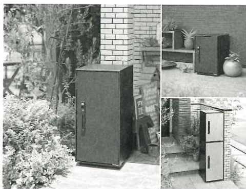
後付け用宅配ボックス コンボ-ライト

荷物の配達・受け入れがカンタン! 床面に本体をしっかり 固定するので、防犯面も安心です。(電気も不要です。)