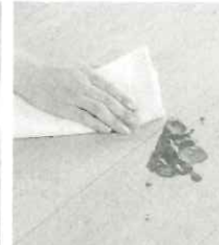
アーキスペックベリティス