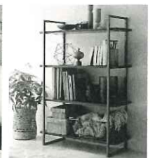
フレームシェルフ