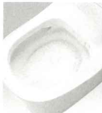
全自動おそうじトイレ